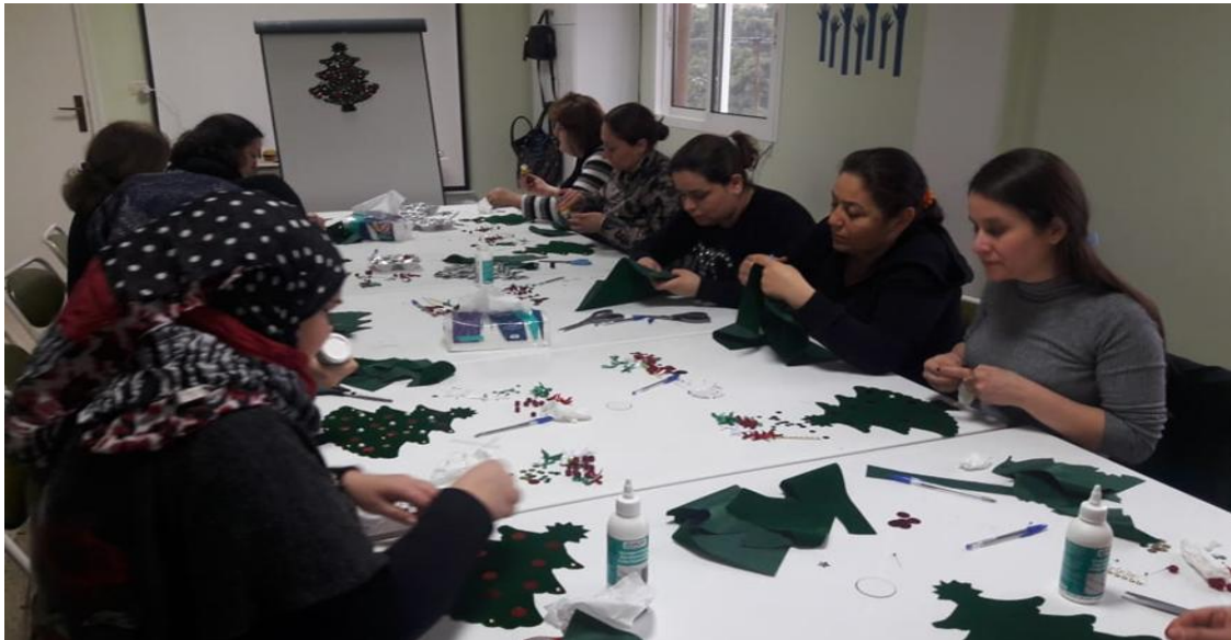
نشاطات لنساء لاجنات، برنامج الدعم النفسي