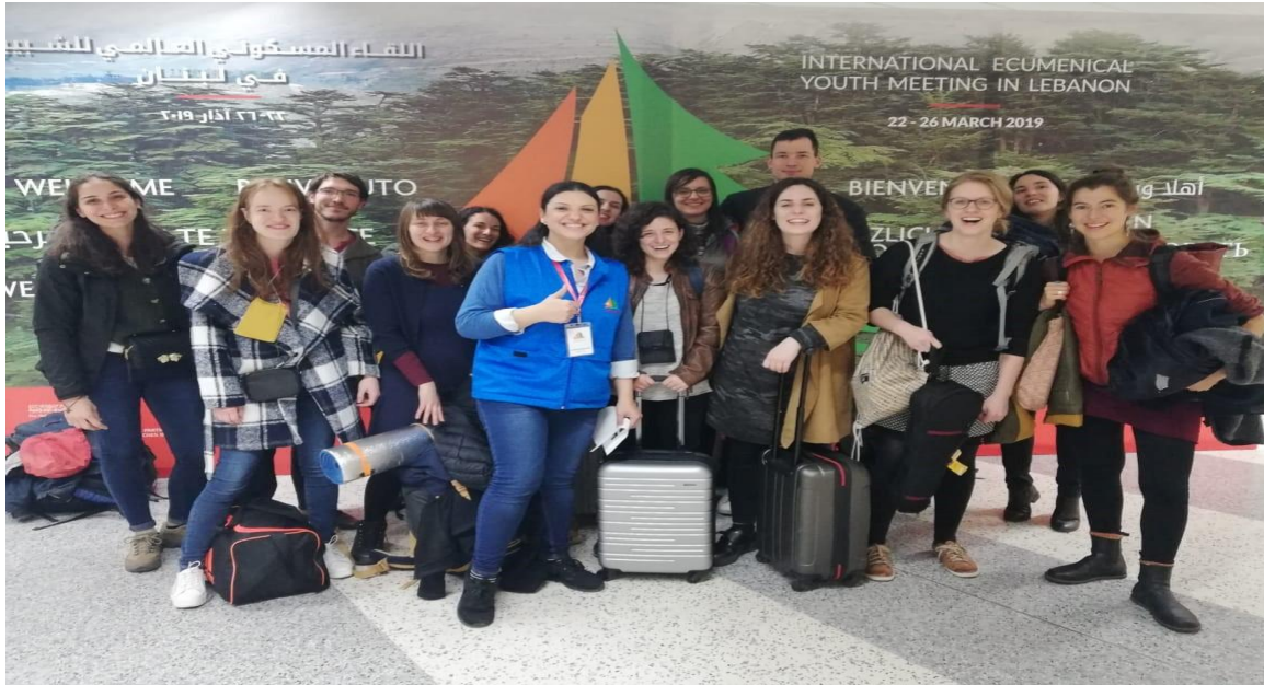
الصورة 2: وصول أول مجموعة من الشباب من أوروبا في 22 آذار/مارس.

في 22 آذار/مارس ، بدأت وفود الشباب في الوصول إلى لبنان. يمثّل الشبيبة الوحيدة في التنوع في كنيسة المسيح وفرصة للتبادل الثقافي والخبرات الروحية الحية من خلال لقاءات الصلاة وورش العمل. وأقيمت في نفس اليوم، صلاة المساء في كنيسة القلب الأقدس في الجميزة - بيروت، وذلك عشية بدء "اللقاء المسكوني العالمي للشبيبة".