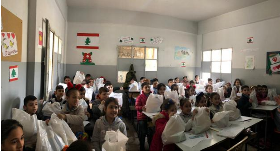
توزيع مستلزمات النظافة على الطلاب في خمس مدارس في جبل لبنان/ دائرة الإغاثة المسكونية، لبنان