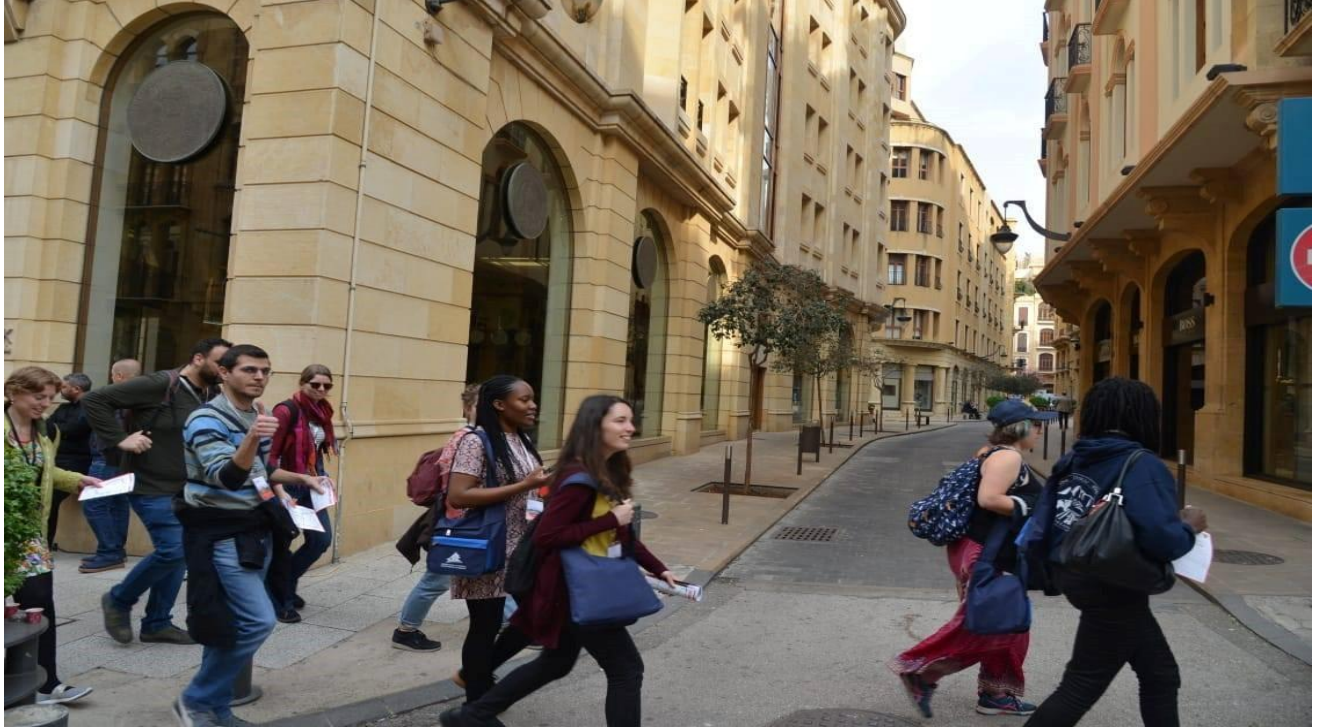
الشباب يمشون سيراً على الأقدام في وسط المدينة للمشاركة في ورش العمل ، 23 آذار/مارس