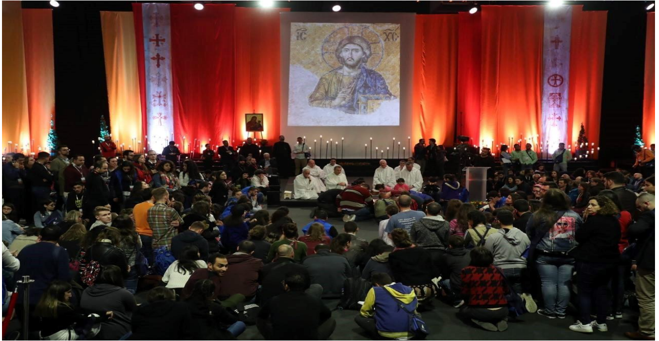
صلاة المساء في Seaside Arena، 24 آذار/ مارس - الصورة: صفحة اللقاء المسكوني العالمي للشبيبة على فيسبوك