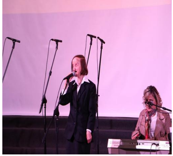
كان لذوي الاحتياجات الخاصة نصيبهم من النعم في "اللقاء المسكوني العالمي للشبيبة"، آذار / مارس 25