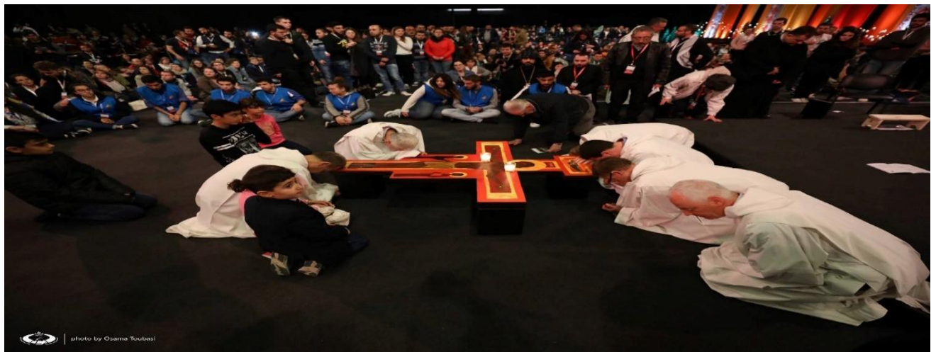
صلاة المساء في Seaside Arena ، 23 آذار/مارس