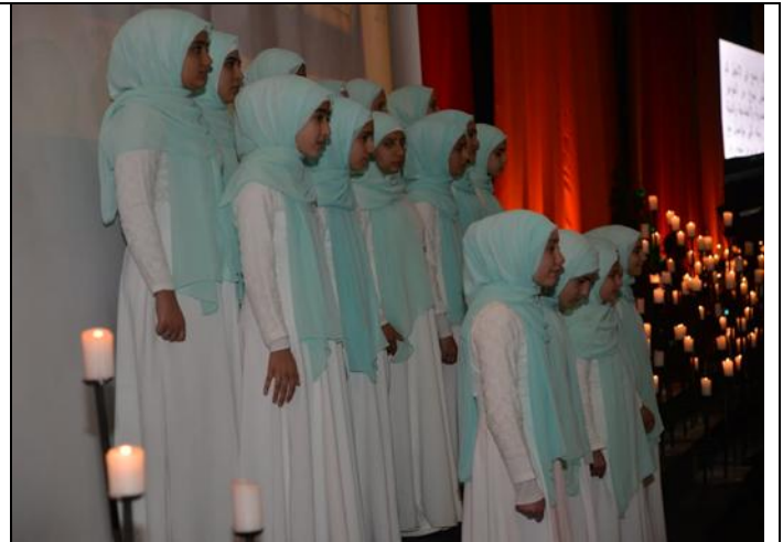
رجال دين مسيحيون ومسلمون يجتمعون معاً لمشاهدة جوقات ترنم أناشيد مسيحية ومسلمة، 25 آذار/مارس