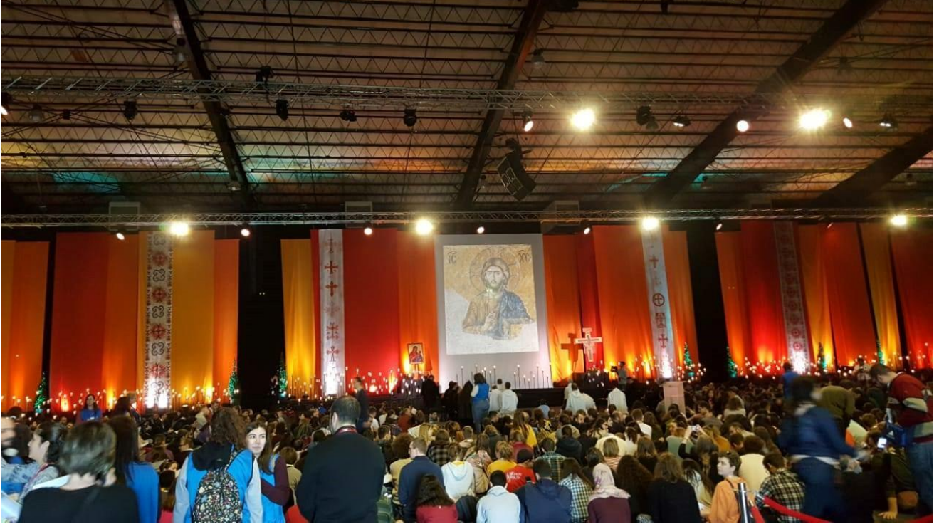
الصورة 4: حشد هائل في seaside Arena - بيروت (23-25 آذار/مارس)