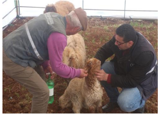
توزيع 600 من أغنام الحوامل والأعلاف ومعدات تصنيع الألبان وإنشاء حظائر لصالح 200 أسرة في المسيفرة في محافظة درعا، 1 آذار/ مارس