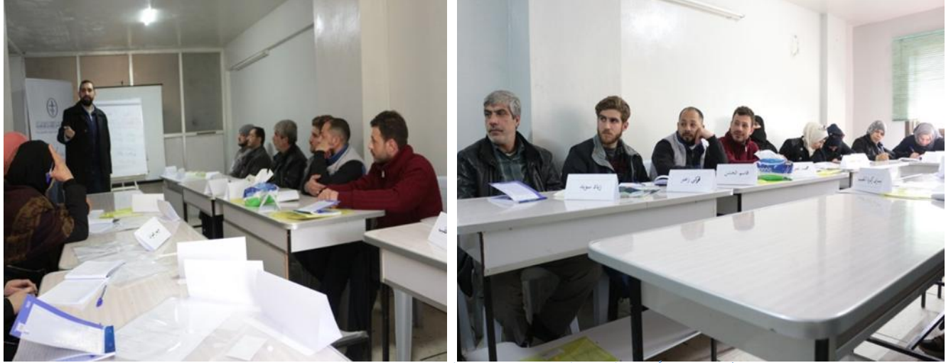
دورة تدريب على إنشاء مشاريع تجارية لـ 18 عاملاً ماهراً في التل في ريف دمشق ، 1 آذار/مارس