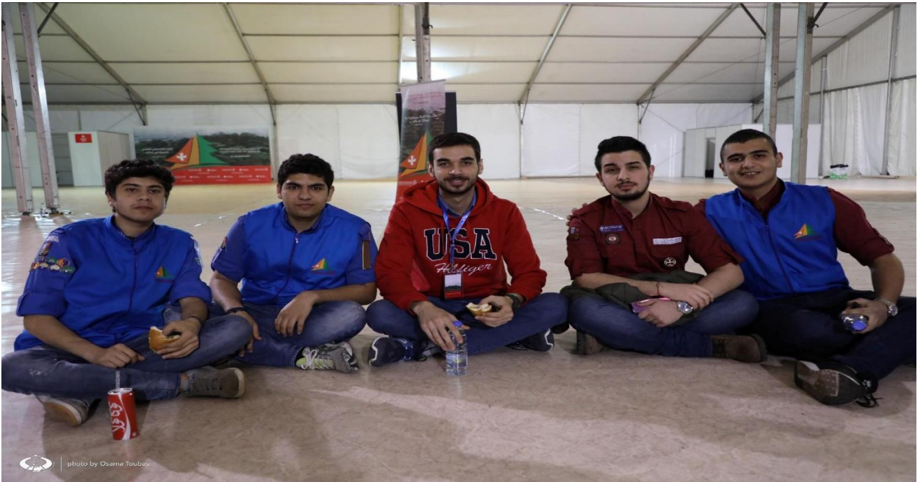
الكشافة المشاركة التي ساعدت في تنظيم وتسهيل اللقاء ، 24 آذار / مارس