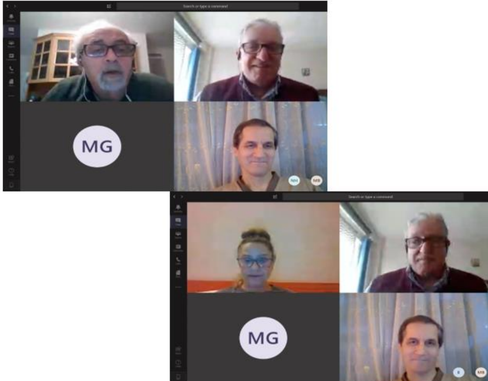
الاجتماع الإلكتروني لدانرتي الدياكونيا وخدمة اللاجئين الفلسطينيين، 6 أيار/ مايو 2020.