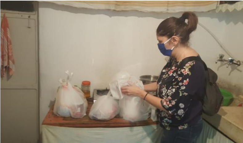
مساعدة كبار السن، أيار/ مايو 2020، مصدر الصورة: دياكونيا