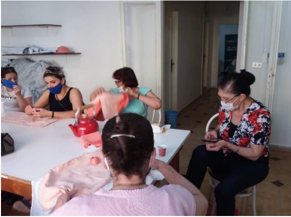
جلسات أعمال يدوية في النبعة وسدّ البوشرية، أيار/ مايو 2020، مصدر الصورة: دياكونيا