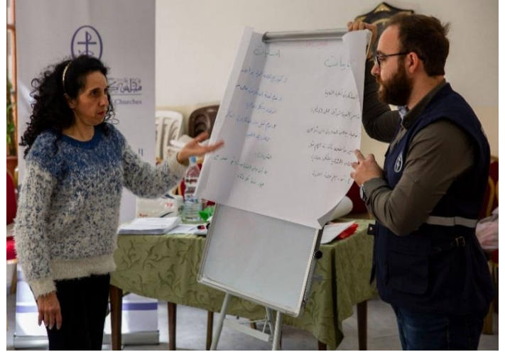
دورات توعية صحية تنشيطية شاركت لـ ٦٠ امرأة، آذار/مارس ٢٠٢٠