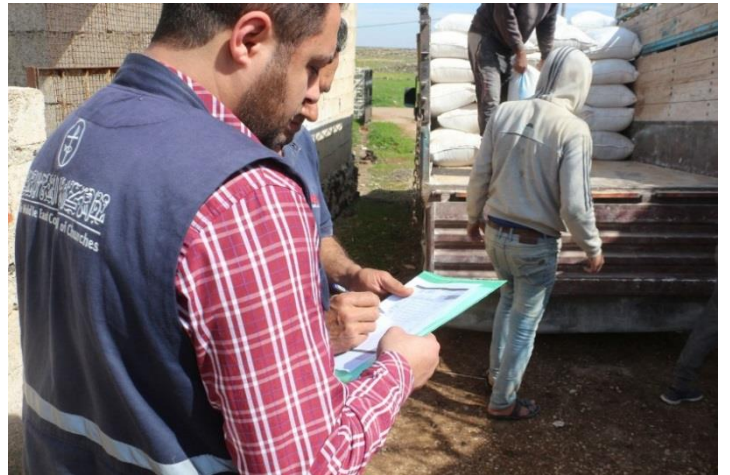
توزيع كميات من علف الماشية على ٤٠٠ مستفيد في درعا، آذار/مارس ٢٠٢٠