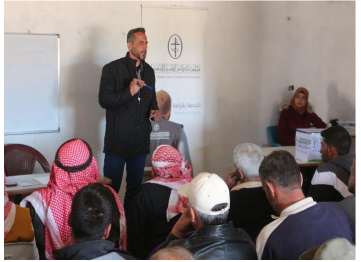
تدريب تقني على تربية الماشية، آذار/مارس ٢٠٢٠، مصدر الصورة: موقع مجلس كنائس الشرق الأوسط