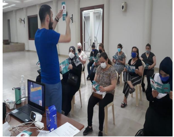
جلسات دعم نفسي واجتماعي للأطفال وجلسات حول العنف الأسري للسيدات، حزيران/ يونيو 2020، مصدر الصورة: دائرة الدياكونيا