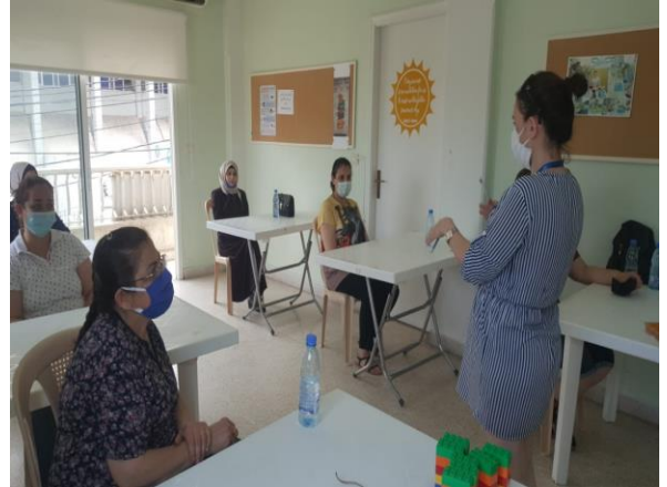
جلسات حول المهارات الشخصية والتوعية الصحية، حزيران/ يونيو 2020، مصدر الصورة: دائرة الدياكونيا