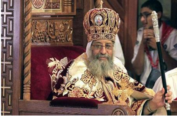
قداسة بابا الإسكندرية وبطريك الكرازة المرقسية تواذروس الثّاني، 1 حزيران/ يونيو 2020، مصدر الصورة: رويترز