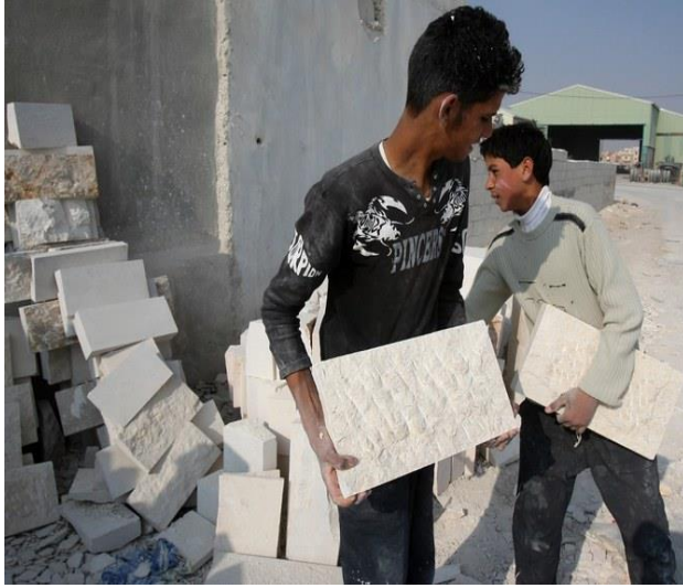
مراهقون أردنيون يعملون في ورشة لقطع الحجارة في منطقة سحاب الداخلية، التي تقع على بعد 40 كم من جنوب عمان، 22 كانون الأول/ ديسمبر 2008.