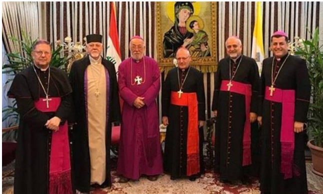
غبطة الكاردينال لويس رافاييل ساكو مع أعضاء من البطريركية الكلدانية في العراق، 17 حزيران/ يونيو 2020