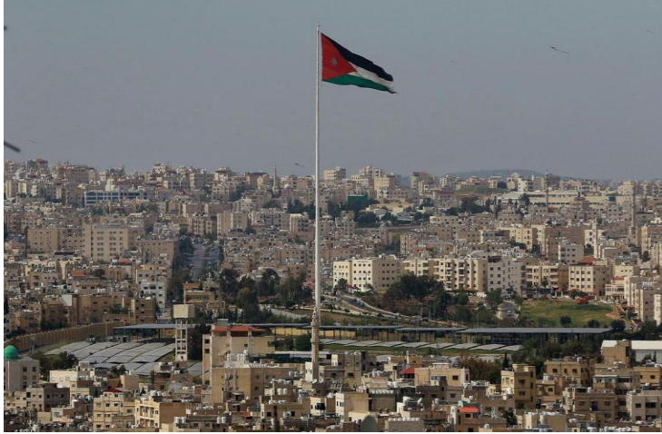
إعلان الحكومة الأردنية، في 14 حزيران/ يونيو 2020، عن خطوات جديدة لمكافحة الفساد والتهرب الضريبي.