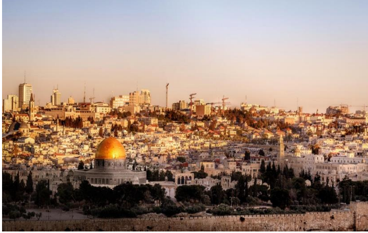
القدس، فلسطين، مصدر الصورة: موقع البوابة