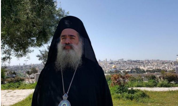
سيادة المطران عطا الله حنا، 19 حزيران/ يونيو 2020