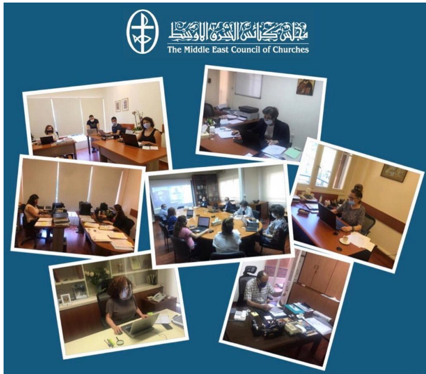
فريق عمل مجلس كنائس الشرق الأوسط يعود إلى مكاتبه، حزيران/ يونيو 2020.

لأنّ الحياة أقوى، ورجاؤنا حيّ بيسوع المسيح إلهنا، عاد النبض الى مكاتب الأمانة العامة لمجلس كنائس الشرق الأوسط في بيروت بعد أكثر من 3 أشهر من الحجر الصحيّ بسبب إجراءات الوقاية من جائحة كورونا كوفيد - 19 والتزام فريق العمل بالعمل من المنازل.