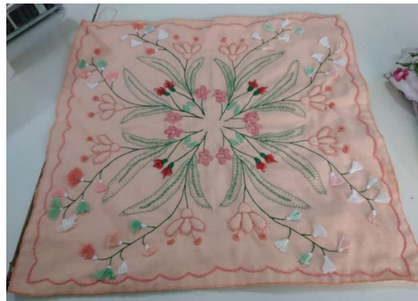
توزيع قسائم شرائية غير غذائية والمعدّات الضرورية لدورة التطريز، حزيران/ يونيو 2020، مصدر الصورة: دائرة الدياكونيا