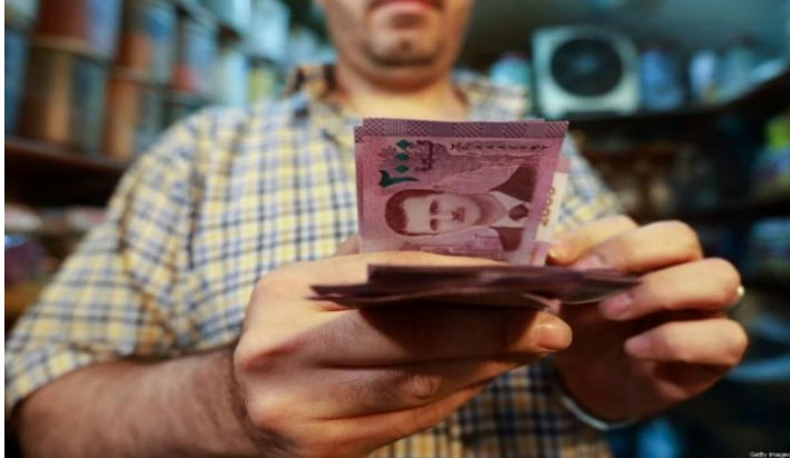
تاجر سوري يقوم بعد الأوراق النقدية التي تحمل صورة الرئيس السوري بشار الأسد، في سوق البزورية وسط العاصمة السورية دمشق، في 11 أيلول/سبتمبر 2019.