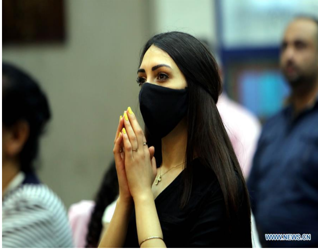
سيدة أردنية كاثوليكية ترتدي الكمامة خلال القداس الإلهي في كنيسة كاثوليكية في عمان، الأردن، 6 حزيران/ يونيو 2020