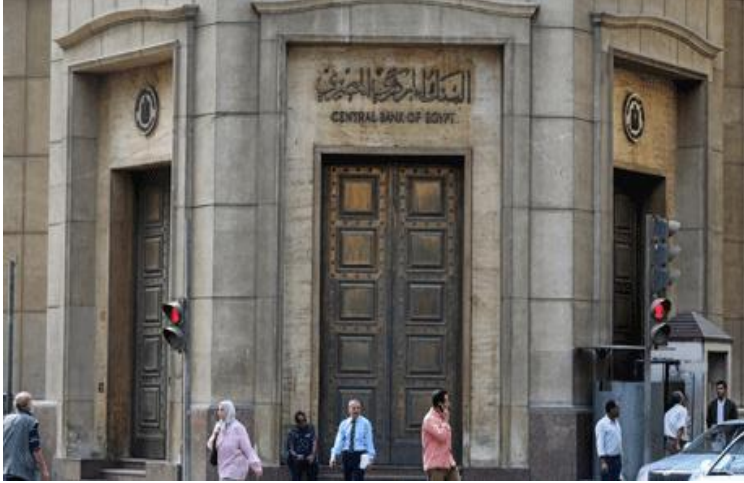
مكاتب البنك المركزي المصري في القاهرة، مصر، حزيران/ يونيو 2020