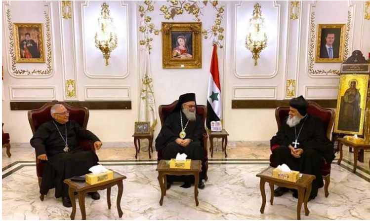
اجتماع البطارقة الثلاثة في المقرّ البطريركي في باب توما، دمشق، 18 حزيران/ يونيو 2020