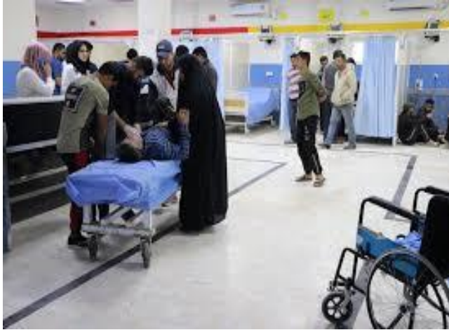
صورة مستشفى مكتظ في العراق. 2 نيسان/ أبريل، مصدر الصورة: Médecins Sans Frontières.

تمّ تسجيل عدد الاصابات بفيروس كورونا، حالات الوفاة وحالات الشفاء منه على النحو التالي: