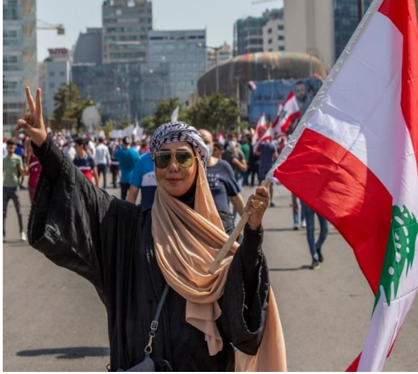
صورة لتظاهرة سلمية في لبنان قبل أن يسود فيها العنف، 7 حزيران/ يونيو 2020، مصدر الصورة: الجزيرة