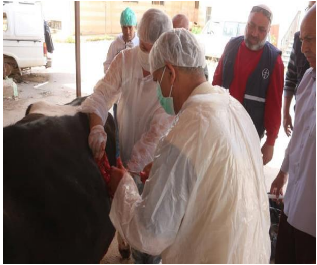
خدمات بيطرية لمئات من أصحاب المواشي في درعا، حزيران/ يونيو 2020