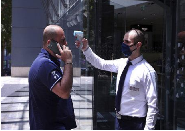
يشهد لبنان انخفاضًا في عدد حالات المصابين بفيروس كورونا، 14 حزيران/ يونيو 2020، مصدر الصورة: نهارنات

تمّ تسجيل عدد الاصابات بفيروس كورونا، حالات الوفاة وحالات الشفاء منه على النحو التالي: