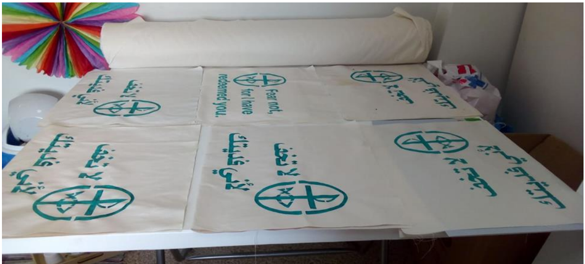
أكياس صديقة للبيئة من صنع المشاركين في جلسات بناء القدرات، شباط/فبراير ٢٠٢٠