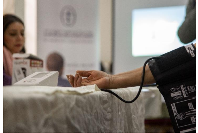
جلسات توعية صحية لـ ٢٠ امرأة في دمشق، شباط/فبراير ٢٠٢٠، مصدر