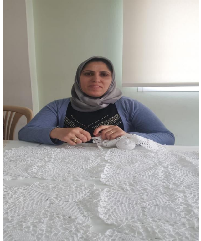
جلسات مهارات شخصيَّة حول حياكة الكروشيه، شباط/فبراير ٢٠٢٠، مصدر الصورة: دياكونيا