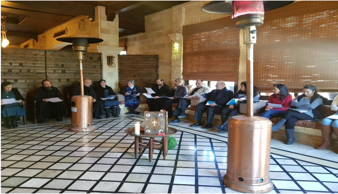
برنامج "الشفاء من الصدمات والمرافقة الروحية" في سوريا، ٢٧ كانون الثاني/يناير - ١ شباط/فبراير

نظمت دائرة الشؤون اللاهوتية والمسكونية في مجلس كنائس الشرق الأوسط دورة أولى من برنامج "الشفاء من الصدمات والمرافقة الروحية" المخصص للرعاة وخدام والرعايا في منطقة المشتاية بوادي النصارى في سوريا، بين ٢٧ كانون الثاني/يناير والأول من شباط/فبراير ٢٠٢٠.