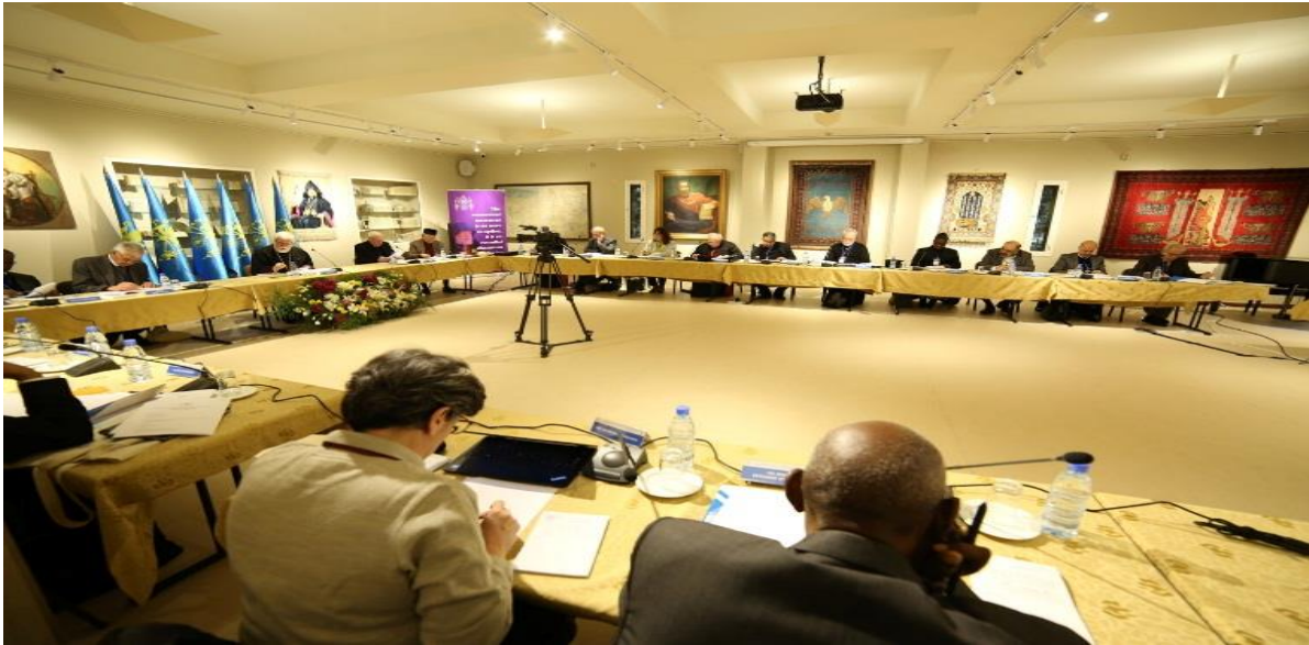
الحلقة الاستشارية التي نظمتها كاثوليكوسية الأرمن الأرثوذكس لبيت كيليكيا، ٦ شباط/ فبراير ٢٠٢٠، مصدر الصورة: موقع MECC

شاركت الأمانة العامة لمجلس كنائس الشرق الأوسط د. ثريّا بشعلاني في حلقة استشارية بعنوان "نحو رؤية مسكونية أكثر شمولاً واستجابة" نظمتها كاثوليكوسية الأرمن الأرثوذكس لبيت كيليكيا بين ٣١ كانون الثاني/يناير و ٢ شباط/فبراير ٢٠٢٠ في مقرها في أنطلياس، لبنان. ترأس قداسة الكاثوليكوس أرام الأول هذه الحلقة المسكونية الدولية التي جمعت لاهوتيين وخبراء بالحركة المسكونية والعلاقات الكنسية من كوريا الجنوبية وبوروندي واندونيسيا والهند والأردن وغانا وروسيا وسويسرا والفاتيكان والسويد وفنلندا وكندا وأميركا ولبنان.