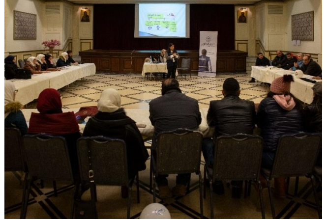
دورة حول حماية الطفل لـ ٤٣ معلماً في ريف دمشق، شباط/فبراير ٢٠٢٠