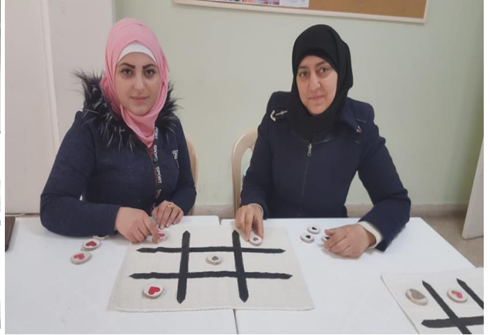
جلسة توعية صحیة (اليسار) وجلسة حول الصحة نفسیة والدعم النفسي الاجتماعي (اليمين)، شباط/فبراير ٢٠٢٠