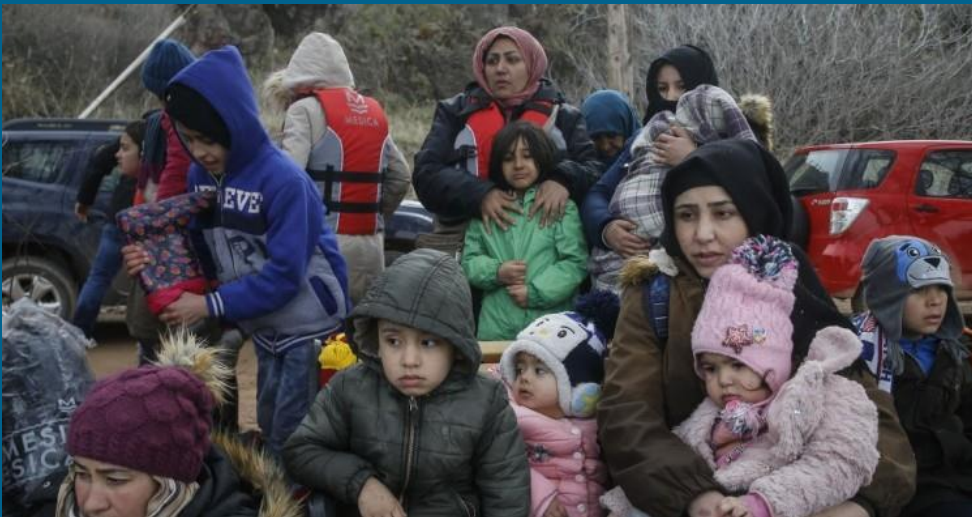
النازحون السوريون من محافظة إدلب، شباط/فبراير ٢٠٢٠، مصدر الصورة: Middle East Institute