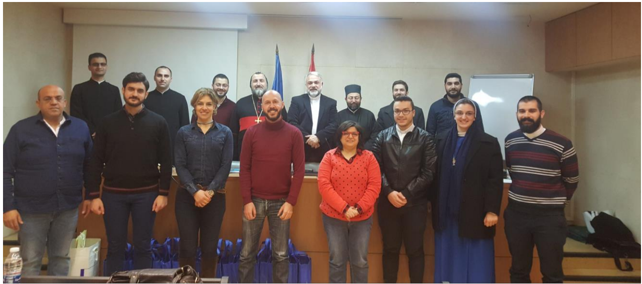
إجتماع طلاب اللاهوت في لبنان وسوريا والعراق، ١ شباط/ فبراير ٢٠٢٠، مصدر الصورة: موقع MECC

عقدت لجنة طلاب كليات اللاهوت في لبنان وسوريا والعراق، المنبثقة عن رابطة الكليات والمعاهد اللاهوتية في الشرق الاوسط، اجتماعها النظامي الأول في الأول من شهر شباط/فبراير ٢٠٢٠، بضيافة كلية اللاهوت الحبرية في جامعة الروح القدس - الكسليك، لبنان، بحضور وبركة سيادة المطران يعقوب باباوي، عميد كلية مار أفرام السرياني اللاهوتية - معزة صيدنايا.