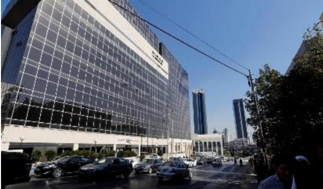
أعلنت خدمة مودي للمستثمرين أنّ مستوى أرباح المصارف في المملكة الهاشمية قد ينخفض جزاء تأثير جائحة كورونا على الاقتصاد، لكنّ احتياطات رأس مال المصارف ما زالت مرتفعة، 29 تموز/يوليو 2020، مصدر الصورة: رويترز