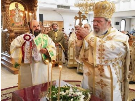
صاحب الغبطة خريسوستوموس الثاني، رئيس أساقفة يوسطينيانا وسائر قبرص، 1 آب/أغسطس 2020