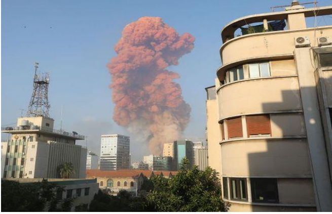
صورة عن انفجار بيروت الهائل الذي وقع في 4 آب / أغسطس 2020 وضرب الإهراءات في المرفأ والعديد من المباني المجاورة، وحرم 300 ألف شخص من منازلهم وألحق أضراراً واسعة بجزء كبير من المدينة، 4 آب/أغسطس 2020، مصدر الصورة: غلف نيوز