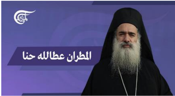
سيادة المطران عطالله حنا في مقابلة مع الميادين، آب/أغسطس 2020، مصدر الصورة: الميادين