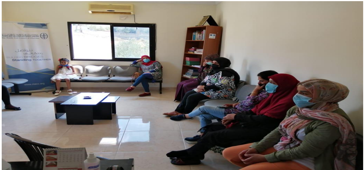
فريق عمل مجلس كنائس الشرق الأوسط وعدد من المتطوعين يقومون بفرز وتقسيم شحنة المساعدات التي وصلت من مصر لتوزيعها إلى المتضررين في لبنان، آب/ أغسطس 2020، مصدر الصورة: دائرة الدياكونيا