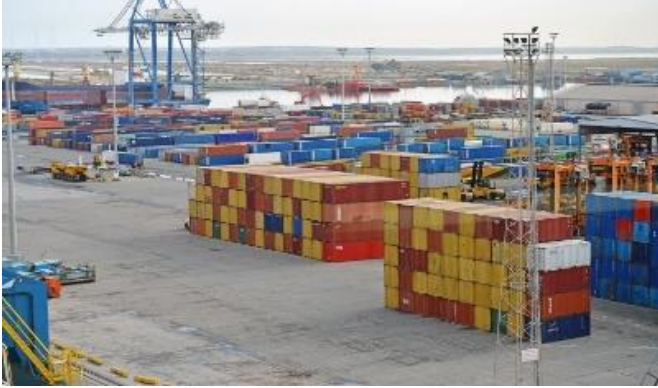
صورة مرفأ في قبرص، 13 آب/أغسطس، مصدر الصورة: فايننشال ميورور