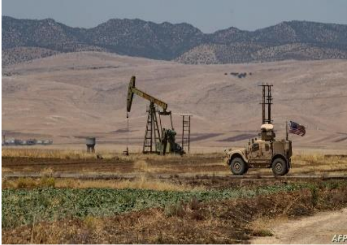
عربة مدرعة أمريكية تمر عبر حقل نفط في ريف بلدة القحطانية في محافظة الحسكة شمال شرق سوريا بالقرب من الحدود التركية، 4 آب / أغسطس 2020