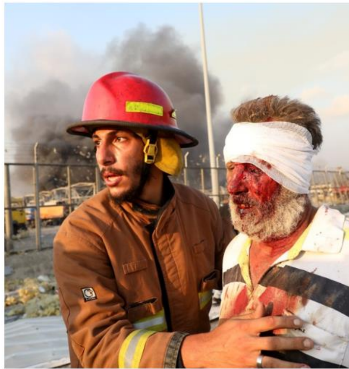
متطوع فى الدفاع المدنى يسعف أحد المصابين جرّاء انفجار بيروت، أب/ أغسطس 2020