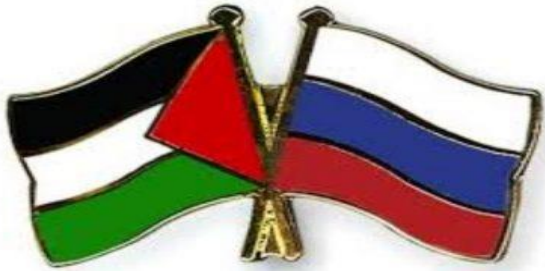
رمز للشراكة الفلسطينية الروسية، 13 آب/أغسطس 2020، مصدر الصورة: وفا.