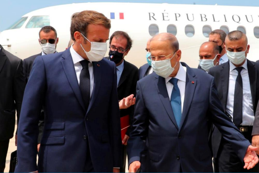
الرئيس الفرنسي إيمانويل ماكرون عند وصوله إلى مطار بيروت وفي استقباله الرئيس ميشال عون، 6 آب/ أغسطس 2020