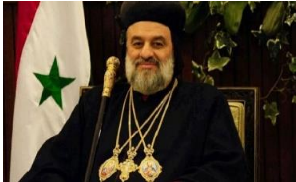
صاحب القداسة مار إغناطيوس أفرام الثاني، بطريرك أنطاكية وسائر المشرق للسريان الأرثوذكس، 22 آب/أغسطس 2020