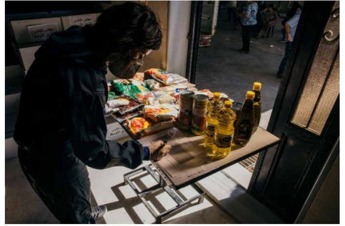
وزيع 730 حصّة غذائيّة و1645 مجموعة أدوات نظافة في جرمانا، آب/ أغسطس 2020