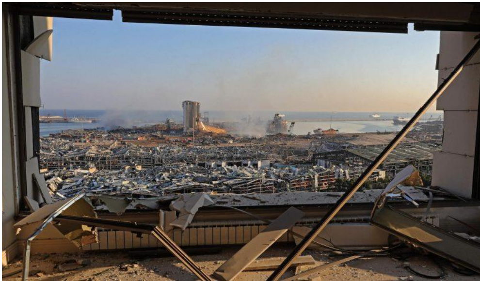
مرفأ بيروت عقب الانفجار الضخم الذي وقع فيه، 4 آب/ أغسطس 2020، مصدر الصورة: موقع مجلس كنائس الشرق الأوسط

رسائل تضامن وتعزية للبنان إلى الأمانة العامة لمجلس كنائس الشرق الأوسط في مقرها الرئيس في بيروت (آب/أغسطس 2020)