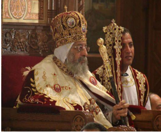
قداسة بابا الإسكندرية وبطريك الكرازة المرقسية تواضروس الثاني، 22 آب/ أغسطس 2020، مصدر الصورة: Egypt Independent