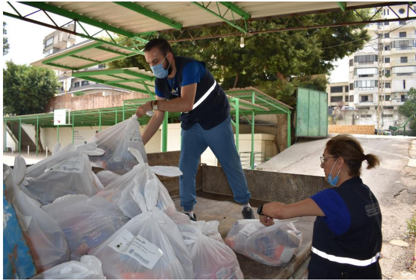
فرز، تقسيم، توضيب وتوزيع المساعدات التي وصلت من مصر، آب/ أغسطس 2020

في إطار النداء الذي أطلقه مجلس كنائس الشرق الأوسط لإغاثة بيروت المنكوبة وأهلها المتألمين جرّاء انفجار الرابع من آب/ أغسطس المرّوع، أسرع قداسة بابا الإسكندرية وبطريك الكرازة المرقسية تواضروس الثاني إلى تلبية هذا النداء من خلال تقديم شحنة مساعدات ضمّت 11 طناً من المواد الغذائية والأدوية والمستلزمات الطبية.