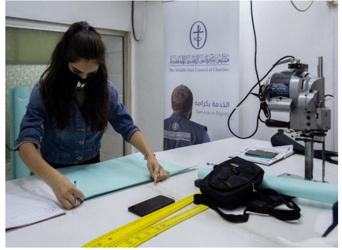
تدريب مهني لـ 25 شابًا في ريف دمشق حول تصفيف شعر الرجال والخياطة، آب/ أغسطس 2020، مصدر الصورة: دائرة الدياكونيا