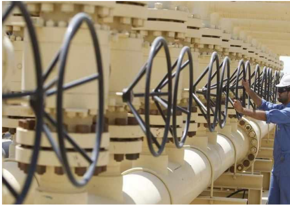
عاملٌ يصلح أنبوباً في حقل الناصرية النفطي الذي يقع على بعد 300 كيلومتر (185 ميلاً) جنوب شرق بغداد، 8 أيلول/سبتمبر 2012.