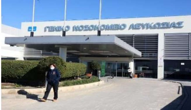
يستمرّ عدد الحالات بالارتفاع مع اعتماد الحكومة إجراءات جديدة، 21 آب/أغسطس 2020، مصدر الصورة: Financial Mirror.

• بدأت قبرص خلال شهر آب/أغسطس بتسجيل حالات جديدة بأرقام مضاعفة. 42