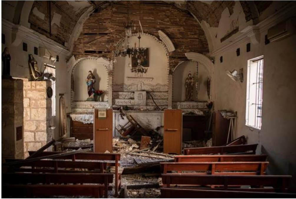
كنيسة صغيرة أثرية منضرة جزاء انفجار بيروت، 4 آب/ أغسطس 2020

المسيح قام! هي صرخة المسيحيين في الشرق الأوسط المتواصلة منذ ألفي سنة للتعبير في الوقت عينه عن إيمانهم وعن مواجهتهم للموت، العدو الأكبر للإنسانية والخلقة. فهذه المنطقة من العالم لم تعرف السلام الحقيقي إلا لفترات متقطعة، وكانت في معظم الأحيان، بسبب حيويتها الدينية والثقافية والتجارية وبسبب وجودها في قلب العالم القديم، معبراً ومكان لقاء ونقطة انطلاق، وفي الوقت عينه ساحة للصراعات والمواجهات. وها هي تعاني منذ نصف قرن المعاناة الأعظم بسبب النزاعات والحروب الدائرة فيها، وبسبب استنشاء العنف والتطرف والاستخفاف بالشخص الإنسانيّ الظاهر من خلال قتله واقتلعه من أرضه وتهجير العقب بمصيره .