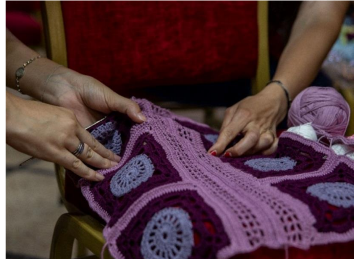
دورة تدريبية حول خياطة الكروشيه لـ 20 سيّدة في ريف دمشق، آب/ أغسطس 2020، مصدر الصورة: دائرة الدياكونيا