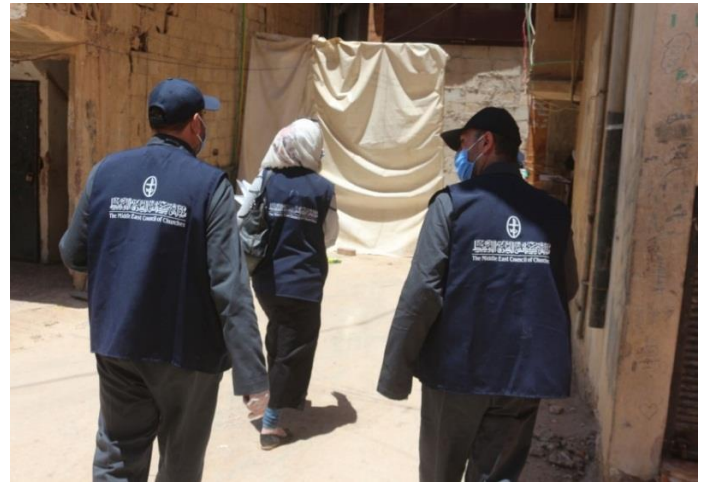
نشاط التوعية الصحيّة وتوزيع مستلزمات النظافة في ازرع ودرعا، آب/ أغسطس 2020