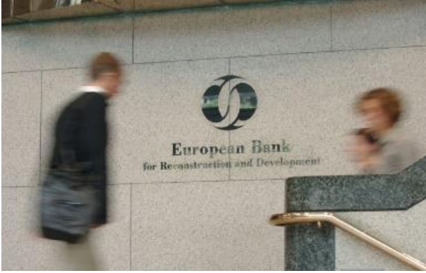
وافق البنك الأوروبي للإنشاء والتعمير (EBRD) على دعم الاقتصاد المصري، 12 آب/أغسطس 2020، مصدر الصورة: إيجيبت إنديبندنت