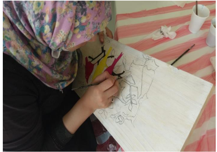
جلسات دعم نفسي واجتماعي، وتطوير المهارات الشخصية والليّنة، آب/ أغسطس 2020