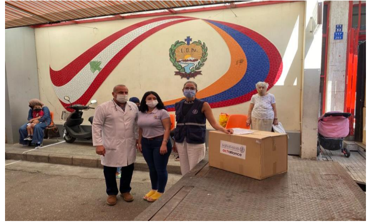
توزيع دفعة من المساعدات، تشرين الأول/ أكتوبر 2020، مصدر الصور: دائرة الدياكونيا