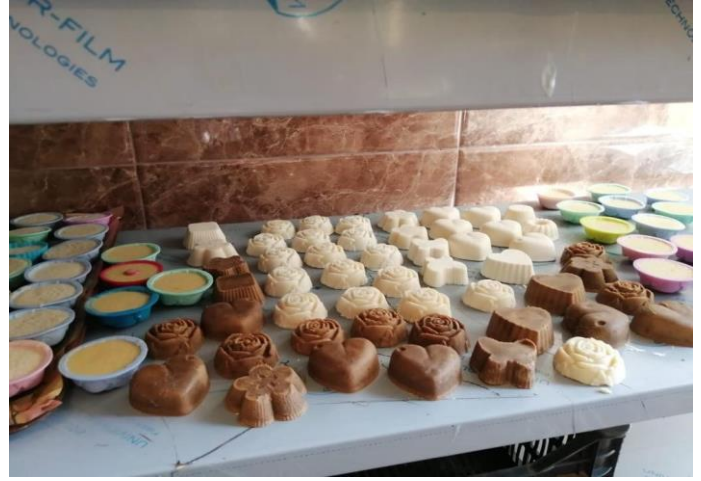
دورات حول كيفية صناعة الصابون، تشرين الأول/ أكتوبر 2020