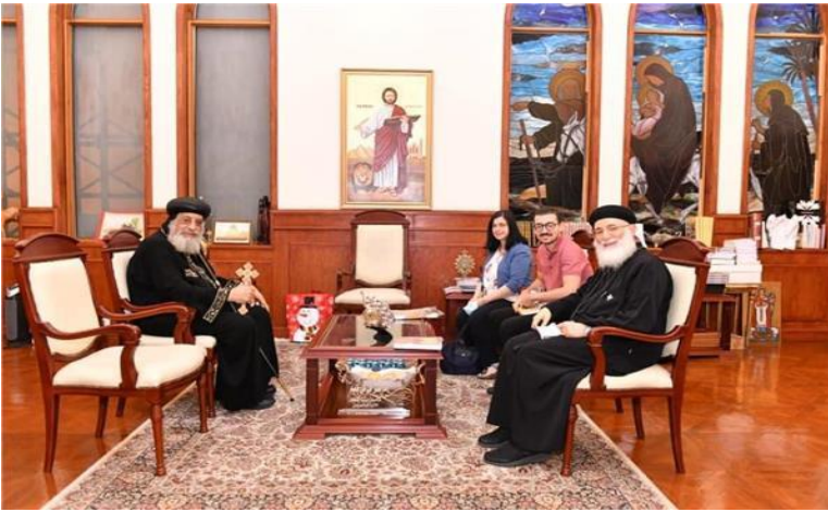
قداسة البابا تواضروس الثاني، 15 تشرين الأول/أكتوبر 2020، مصدر الصورة: قداسة البابا تواضروس الثاني