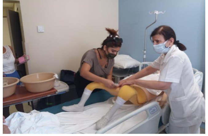
توزيع حصص غذائية وتنظيم دورات حول الرعاية المنزلية، تشرين الأول/ أكتوبر 2020، مصدر الصور: دائرة الدياكونيا