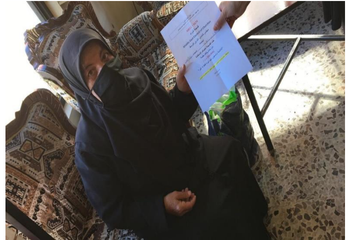
دورات حول المهارات البسيطة وتوزيع قسائم شرائية، تشرين الأول/ أكتوبر 2020، مصدر الصورة: دائرة الدياكونيا