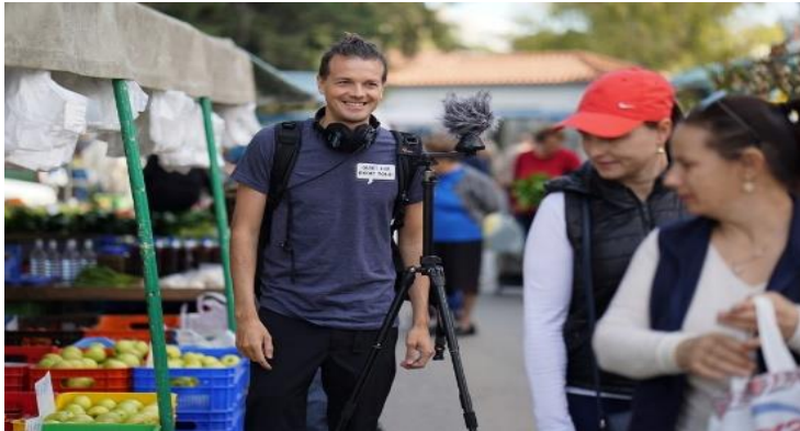
عاد الإقتصاد القبرصي إلى الإزدهار متعافٍ من أزمة القطاع السياحي. تشرين الأول/ أكتوبر 2020، مصدر الصورة: Cyprus Mail