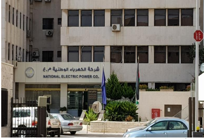
تعمل الأردن على رفع كفاءة استخدام الطاقة من خلال التعاون مع بنك الاستثمار الأوروبي، 9 تشرين الأول/ أكتوبر 2020، مصدر الصورة: Econ Strum.