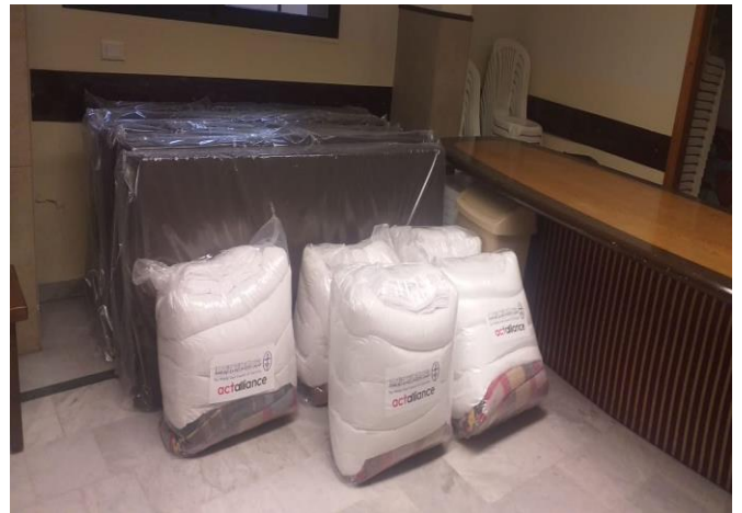
توزيع دفعة من المساعدات، تشرين الأول/ أكتوبر 2020، مصدر الصور: دائرة الدياكونيا