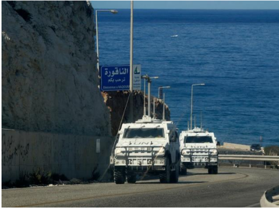
تم عقد المفاوضات بين لبنان وإسرائيل في مقر قيادة اليونيفيل في منطقة الناقورة على الحدود اللبنانية، 14 تشرين الأول/ أكتوبر 2020.