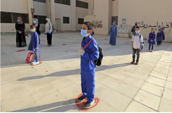
طلاب أردنيون مرتدين الكمامات الوقائية وملتزمين بالمسافات الآمنة في اليوم الدراسي الأول، أيلول/ سبتمبر 2020، مصدر الصور: عرب نيوز.