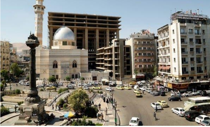
بعد أن رفعت الحكومة السوريّة أسعار الوقود والبنزين، ارتفعت بالتالي أسعار السلع والمنتجات السوريّة. 19 حزيران/ يونيو 2020، مصدر الصورة: رويترز