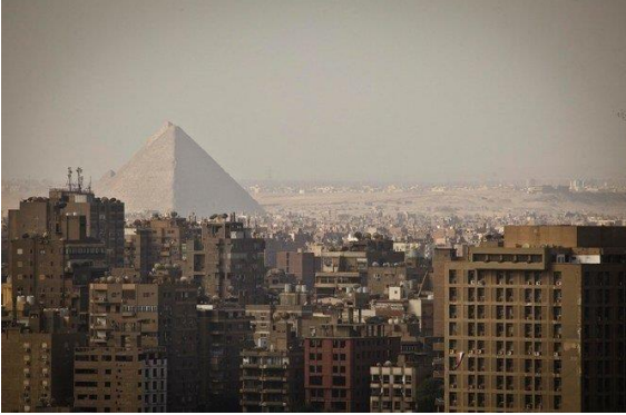
مشهد الإهرامات من مدينة الجيزة، على بعد 4.9 كم جنوب غرب القاهرة، مصدر الصورة: AP.