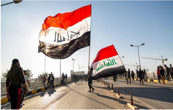
لا يزال الاقتصاد العراقي في خطر، ما دفع المنظمات إلى طلب الإصلاح، تشرين الأول/ أكتوبر 2020، مصدر الصورة: Shutterstock