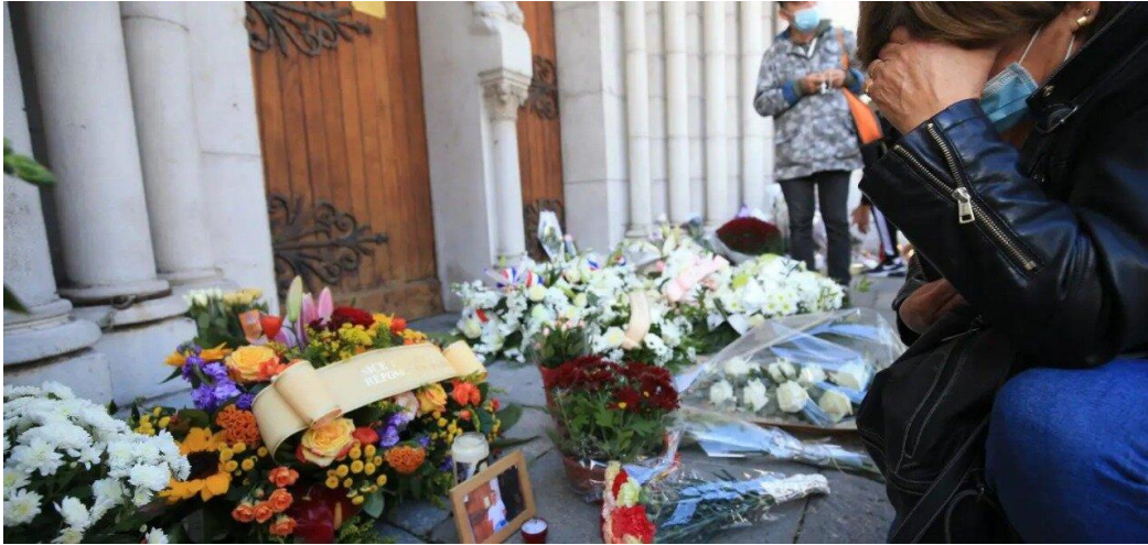
الصورة من أمام كاتدرائية نيس، فرنسا، تشرين الأول/ أكتوبر 2020.

أدان مجلس كنائس الشرق الأوسط الجرائم النكراء التي شهدتها فرنسا في الأيام الأخيرة واعتبر في بيان له أن " العنف جريمة ضد الله والإنسانية فكيف إذا أتى متلبساً الدين خياراً تبريراً بما يُناقض رسالة كل الأديان القائمة على المحبة والسلام والتعاقد والإقرار بالحق بالاختلاف والتفاعل مع التنوع كغنى في الإرث الحضاري!".