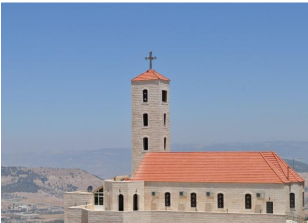
مجلس رؤساء الكنائس في الأردن "يوأكب الأحداث المأساوية التي وقعت في فرنسا بسبب الإساءة للرموز الدينية الإسلامية"، 26 تشرين الأول/أكتوبر 2020، مصدر الصورة: قناة المملكة