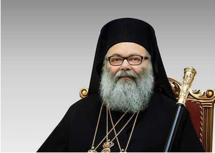
غبطة بطريرك أنطاكية وسائر المشرق للروم الأرثوذكس يوحنا العاشر، 13 تشرين الأول/ أكتوبر 2020.