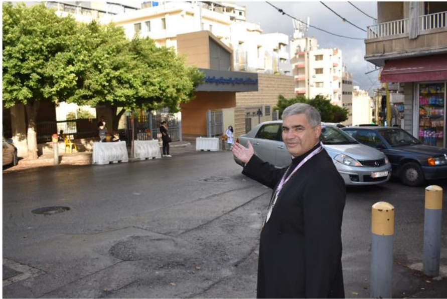
سيادة المطران جورج أسادوريان، النائب البطريركي لكنيسة الأرمن الكاثوليك، وعضو اللجنة المسكونية لإغاثة بيروت، تشرين الأول/ أكتوبر 2020، مصدر الصورة: موقع مجلس كنائس الشرق الأوسط

لحظة دوى انفجار مرفأ بيروت المشؤوم كان يتوجّه بسيارته الصغيرة إلى مبنى البطريركية في الأشرافية، منطقة الجعيتاوي. وفي أقلّ من ثوانٍ وجد المطران نفسه ينقل الجرحى الهائمين بدمائهم ودموعهم على الطرق بسيارته من مستشفى إلى آخر!