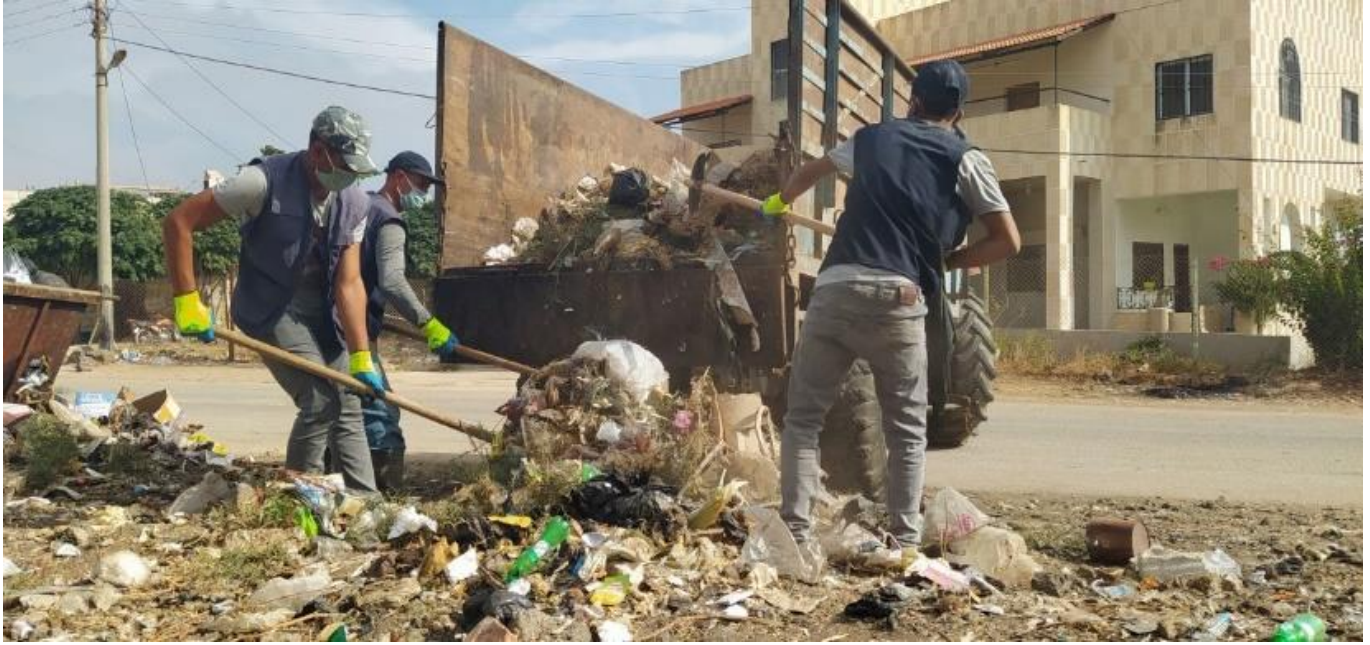
نشاطات إدارة النفايات في ازرع والشيخ مسكين، تشرين الأول/ أكتوبر 2020