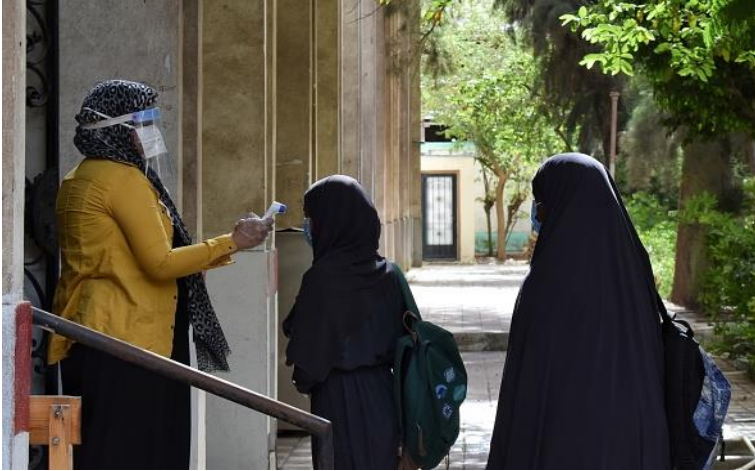
بدء امتحانات نهاية السنة لطلاب الصفوف الثانوية والثانوية الأزهرية، وسط إجراءات احترازية شديدة، مع تعقيم اليدين، والتأكد من درجة حرارة كل طالب، 21 حزيران/ يونيو 2020، مصدر الصورة: زياد أحمد/ NurPhoto via Getty Images.

تمّ تسجيل عدد الإصابات بفيروس كورونا، حالات الوفاة وحالات الشفاء منه على النحو التالي: