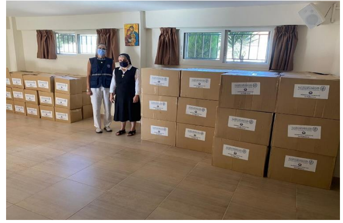
تنظيم جلسات تدريب حول مهارات الحياة بالشراكة مع منظمة Norwegian Church Aid وتوزيع دفعة من المساعدات، تشرين الأول/ أكتوبر 2020