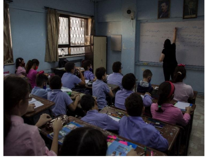
تأمين الأقساط المدرسية دعمًا لـ270 تلميذًا وتلميذة، تشرين الأول/ أكتوبر 2020، مصدر الصورة: دائرة الدياكونيا