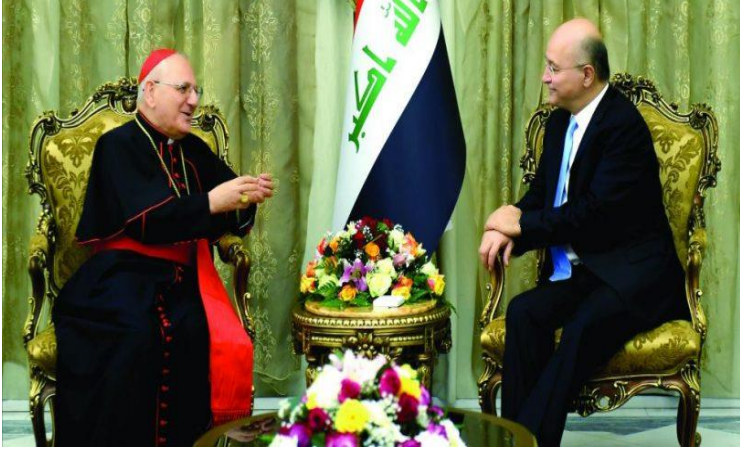
غبطة بطريرك بابل للكلدان ورئيس الكنيسة الكلدانية الكاثوليكية الكاردينال مار لويس رافايل ساكو مع الرئيس العراقي برهم صالح، 18 تشرين الأول/ أكتوبر 2020، مصدر الصورة: iraqakhbar.com