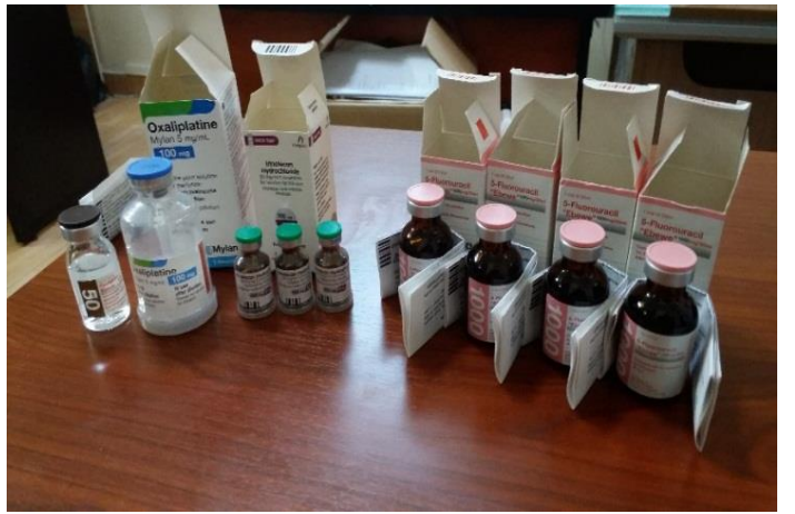
أدوية لمرضى السرطن، تشرين الأول/ أكتوبر 2020، مصدر الصورة: دائرة الدياكونيا