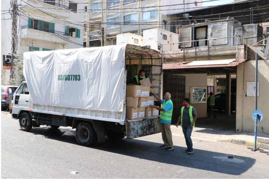
فريق عمل دائرة الدياكونيا يقمّ دفعة جديدة من المساعدات إلى المسؤولين في الكنائس الأعضاء، تشرين الأول/ أكتوبر 2020

في إطار الندائين الإغاثيين الذين أطلقهما مجلس كنائس الشرق الأوسط على إثر انفجار مرفأ بيروت، قام فريق عمل دائرة الدياكونيا بتقديم دفعة جديدة من المساعدات إلى المسؤولين في الكنائس الأعضاء كي يتم توزيعها بالتالي على العائلات الأكثر ضعفاً وتضرراً من رعايا الكنائس الأرثوذكسية الشرقية، الأرثوذكسية، الإنجيلية والكاثوليكية. برنامج المساعدات هذا جاء بالتعاون والتنسيق مع منظمة "أكت اللابيس" الدولية، حيث ضمت الحصص المقدمة مجموعة من المواد الغذائية الضرورية.