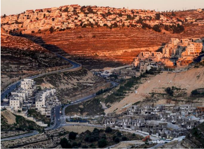
إعمال بناء جارية في مستوطنات جعفات الإسرائيلية غير القانونية بالقرب من رام الله في الضفة الغربية المحتلة، 5 تشرين الأول/أكتوبر 2020، مصدر الصورة: Middle East Monitor